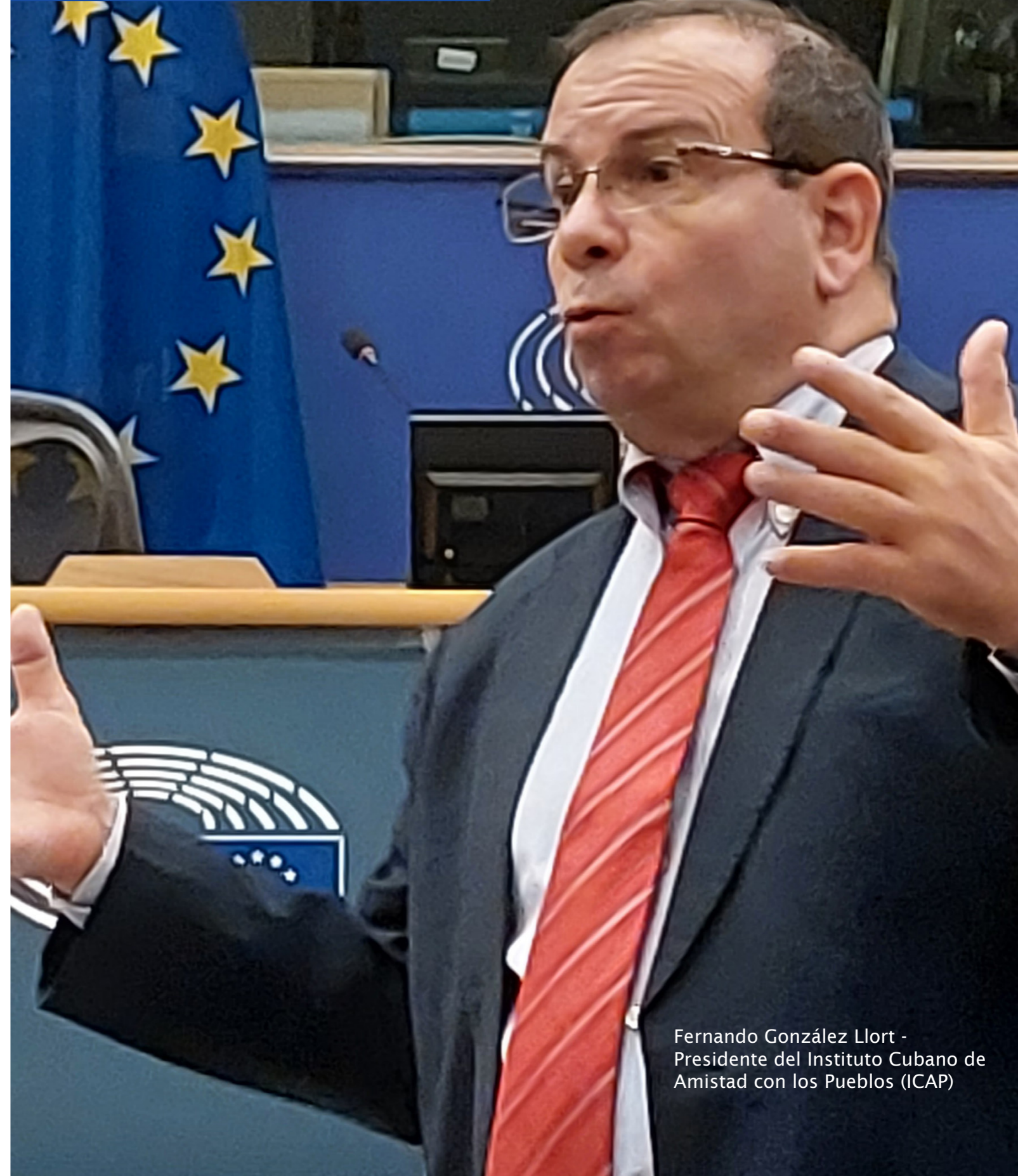
Fernando González Llort - Presidente del Instituto Cubano de Amistad con los Pueblos (ICAP)