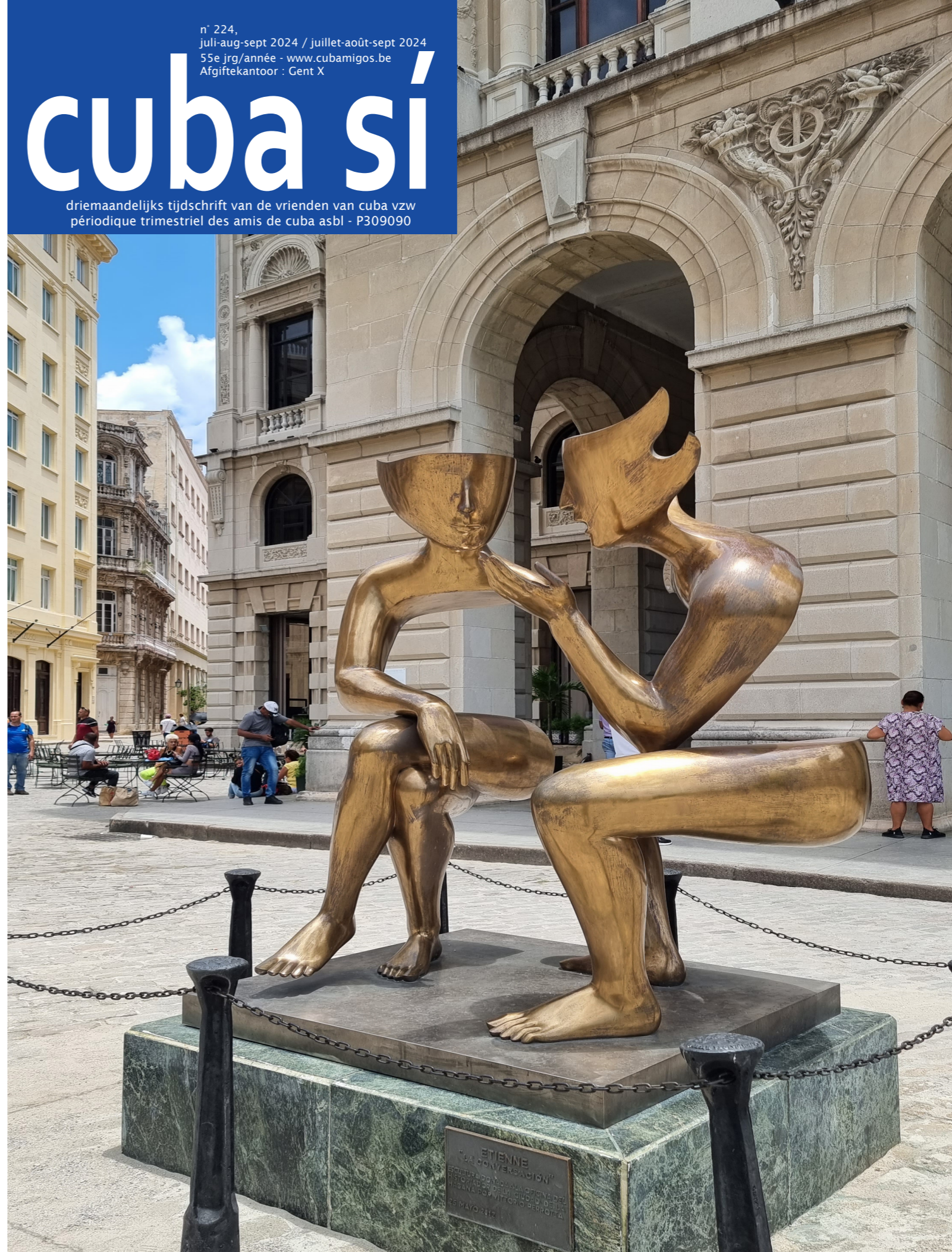
La Conversación: escultura diseñada por el artista francés Etienne Pirot - 2012 - Plaza San Francisco de Asís - La Habana Vieja