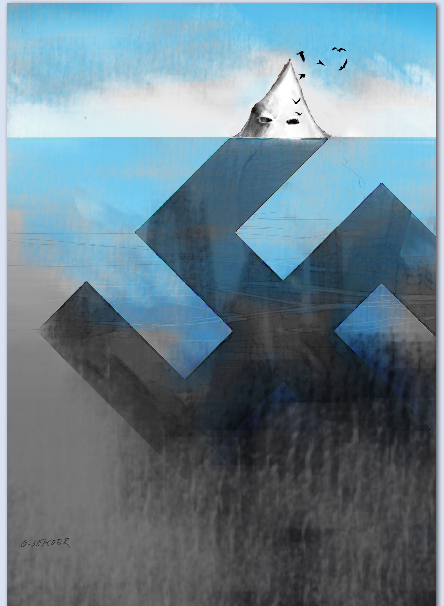
Grote Prijs 1ste Biënnale politieke humor in Havana - werk van Luc Descheemaeker - zie artikel p.8